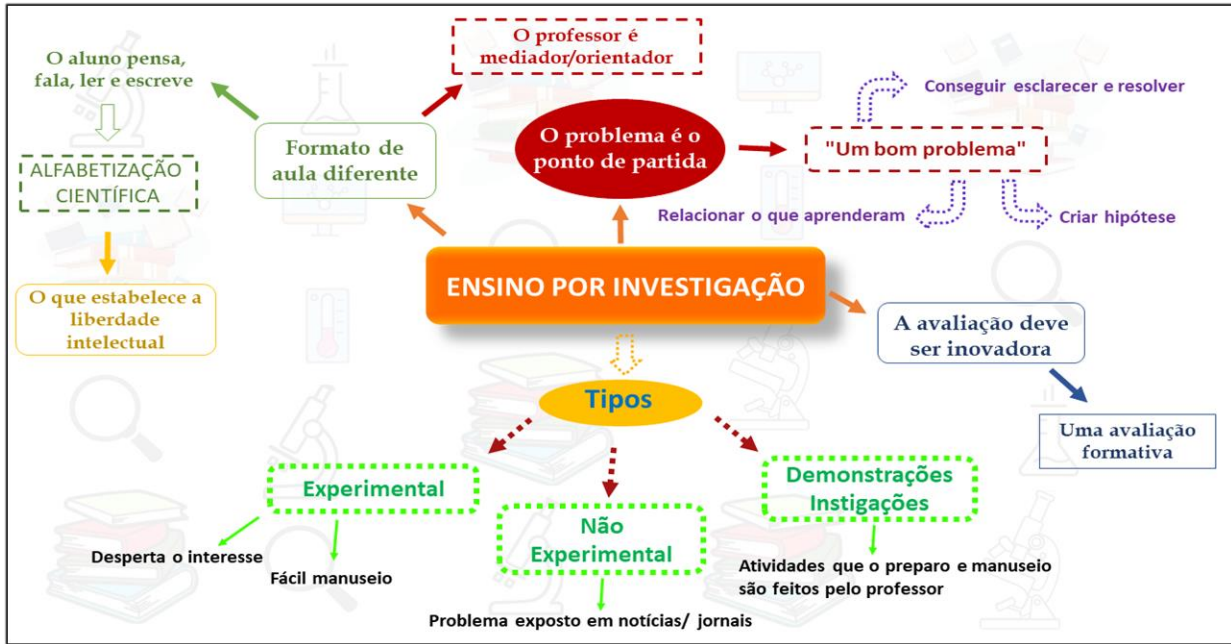
Figura 02: Mapa conceitual do Grupo 01