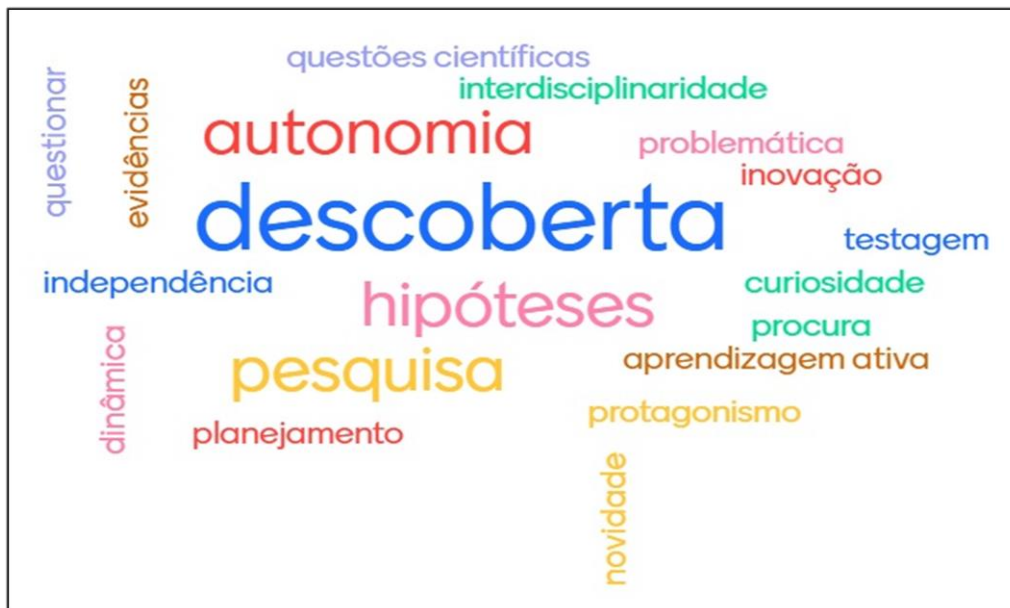
Figura 1: Nuvem de palavras no Mentimeter

Durante a Oficina de Discussão, cabe ressaltar que todos os participantes foram incentivados a se envolver colaborando na construção das atividades propostas, a fim de que fossem indicadas as palavras e a relação entre elas. Esta atividade inicial foi retomada para a elaboração de um mapa conceitual coletivo em etapa posterior desta Oficina de Discussão. A referida Nuvem de Palavras (Figura 01) pode ser visualizada a seguir: