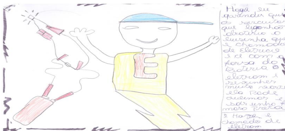
Figura 7: Relato na etapa da sistematização individual do conhecimento

Dessa forma, as crianças desenvolveram o momento de sistematização do conhecimento individual, dos 18 alunos que realizaram a atividade selecionamos alguns relatos para demonstrar como as crianças desenvolveram o raciocínio após o experimento da SEI. Notamos nesta etapa a mesma situação vivenciada nas etapas anteriores quando solicitávamos que escrevessem e desenhassem a maioria apenas ilustra com desenhos e relata a sua satisfação na realização das atividades. Vejamos abaixo alguns relatos que mais nos chamaram atenção: