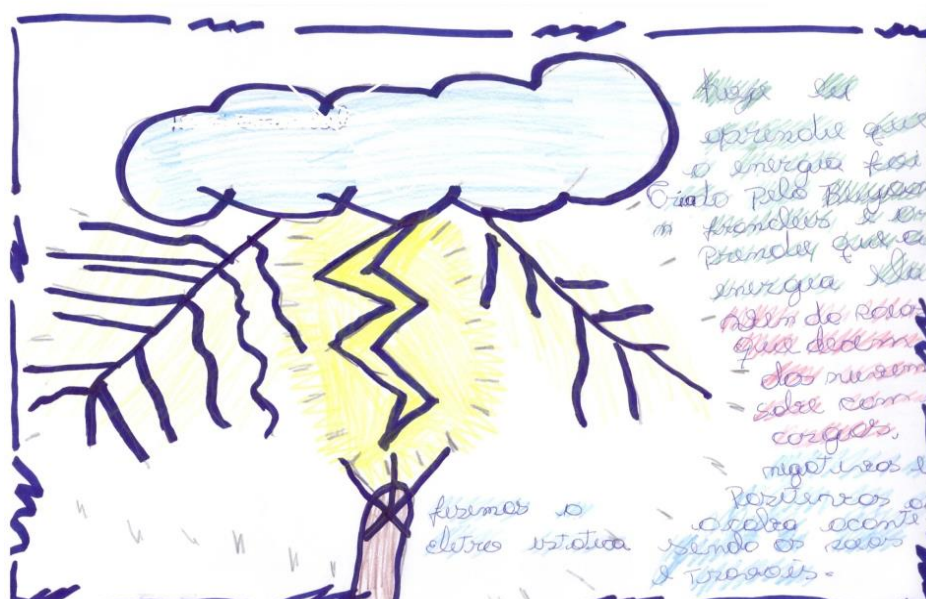
Figura 3: Registros escritos do primeiro dia da sequência didática

Diante dessa proposta, e ao concluírem as atividades solicitamos que eles fizessem os registros escritos e ilustrassem com os desenhos relatando as atividades desta aula. Ao analisarmos a escrita e as ilustrações percebemos a dificuldade dos alunos em relatar o que vivenciaram, a maioria apenas demonstrou com desenhos e quando escreviam não sabiam argumentar, grande parte expressou a satisfação em realizar as atividades e gostariam que tivesse mais vezes. Vejamos abaixo os registros: