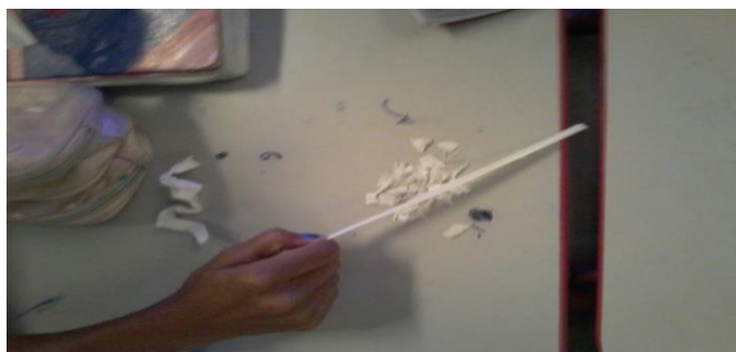
Figura 1: Atrair papel picado ao ser atritado com o canudo.