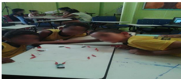
Figura 6: Momento que o grupo conseguiu montar o circuito

As figuras revelam os circuitos montados: